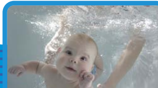
Нырание и плавание