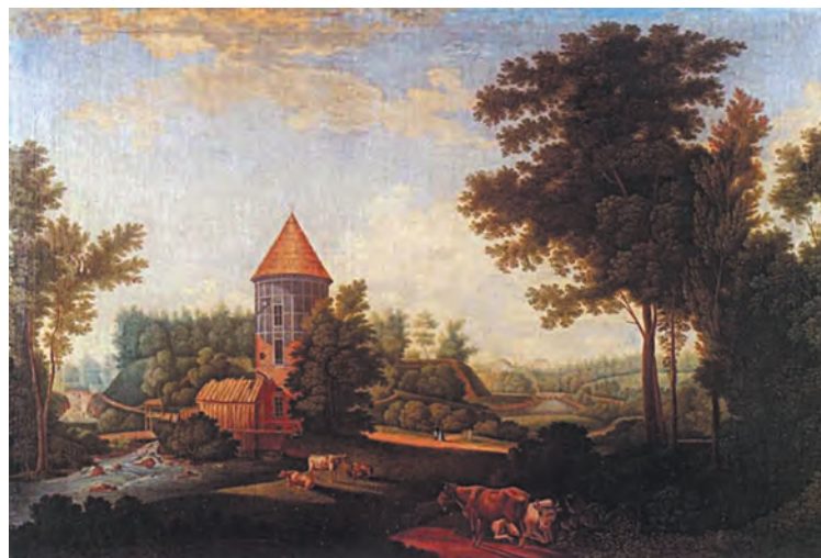
«Мельница и Пиль-башня в Павловске» (в оригинале – “The Mill and the Peel Tower at Pavlovsk”), 1792

Широкую известность получила серия его полотен с видами реки Славянки в Павловском парке, которая по сути и сделала его признанным мастером пейзажной живописи.