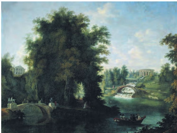
«Вид в Павловске с большим дворцом, мостиком с кентаврами и каскадом», конец 18 века

Кроме этих широко известных произведений слова и кисти, известно и великое множество других, в том числе и иностранных, что и неудивительно, учитывая, что многие поэты, писатели и живописцы, почтили своим личным присутствием берега Славянки. Но это уже тема другого разговора, мы же перейдем ближе к истории.